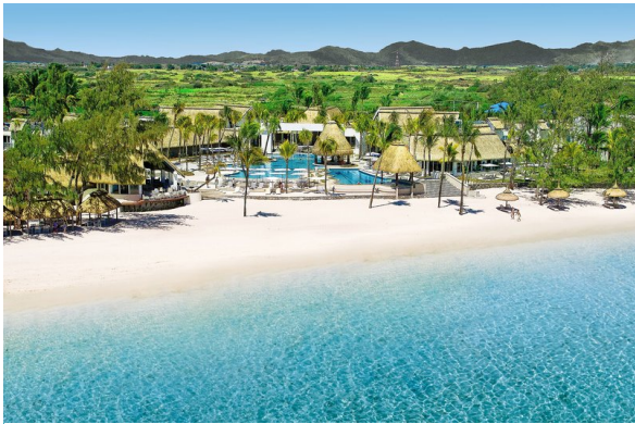
Hotel Ambre Mauritius 4*

Das große Sportangebot des legeren Adult Only Resorts reicht auch für längere Urlaube! Golfer freuen sich auf den anspruchsvollen 18-Loch-Championship-Platz. Und zwischendurch gibt es Badevergnügen und Erholung am 750m langen Traumstrand!