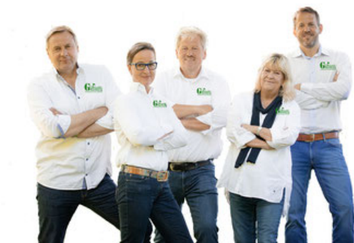
Das Golfreisen Hamburg Team