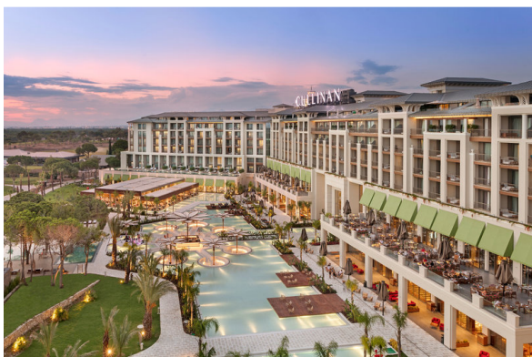
CullinanLuxusurlaub in Belek Hotel Cullinan Golf Resort 5*