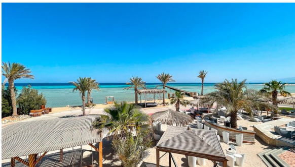
Hotel The Breakers Lodge 4*

The Breakers ist ein Heartbreaker – ein Herzensbrecher! Top-Hotel für Surfer und Taucher, aber auch ein Traum-Plätzchen für Entspannung und Genuss. Der Golfplatz " Soma Bay/Cascades liegt ca 1 km entfernt - Der Transfer zum Golfplatz ist inkl.