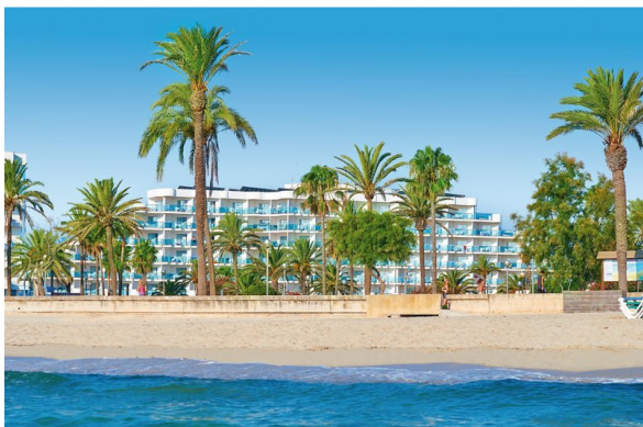
Hotel HipotelsCala Millor Park****+

Das beliebte Komforthotel direkt am Sandstrand von Cala Millor überzeugt mit modernem Komfort im Innen- und Außenbereich. Entspannen Sie sich am Pool oder bei einer Massage im Spabereich