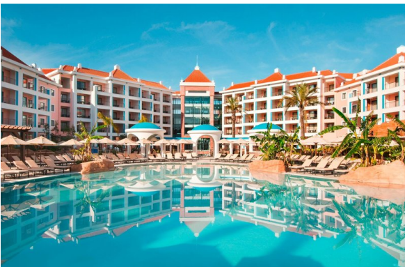
Hotel Hilton Vilamoura As Cascatas Golf Resort & Spa 5*

Freuen Sie sich auf das Hilton Vilamoura, das direkt am Golfplatz Pinhal liegt und von den 5 besten Golfplätzen der Algarve umgeben ist. Es besticht außerdem durch seine maurische